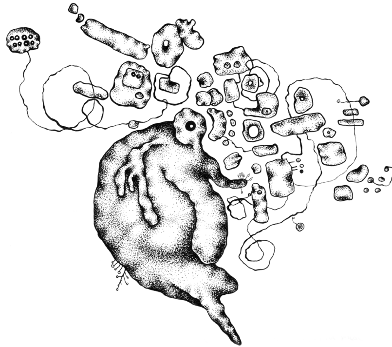
fig 20: Rhetia Muscularis